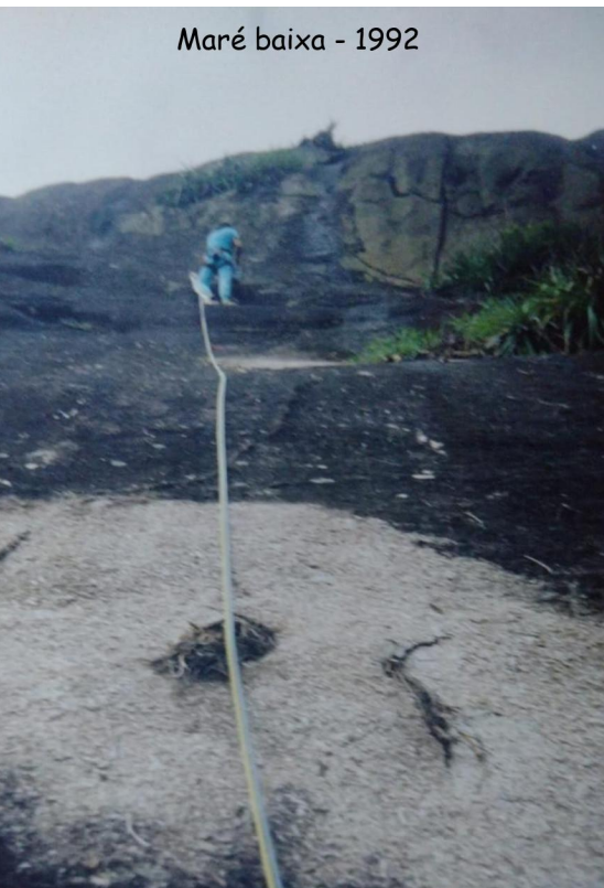
Maré baixa - 1992